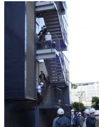
● 本社避難訓練の様子