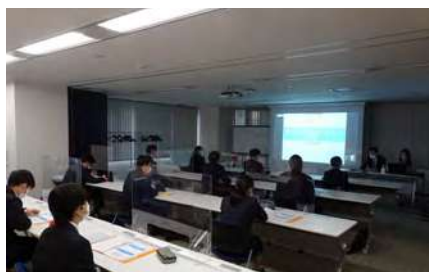
●新入社員入社時研修

新入社員13名に対しフォローアップ研修を実施しました。研修の内容は、働いて半年がたった時点で「仕事の進め方の基本」をおさらいし、半年経って出来たこと、出来なかったこと、今後の目標などオンラインで仲間や先輩と理解を深めました。