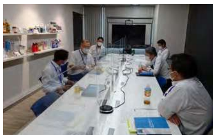
●主管塾(マネジメント研修)