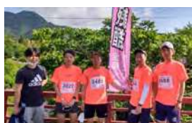
●ランニングクラブ