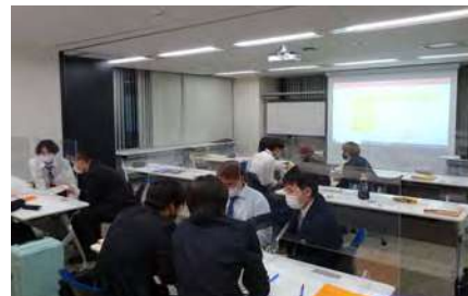
●新入社員フォローアップ研修