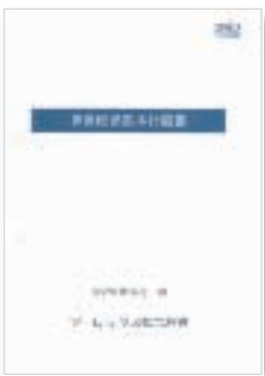
事業継続基本計画書

AED(自動対外式除細動器)の導入、各事業所で「普通救命講習」を次のとおり実施。2007年7月25日、東北工場で12名が講習会を受け、東京工場、本社、兵庫工場、大阪支店と順次、開催された。