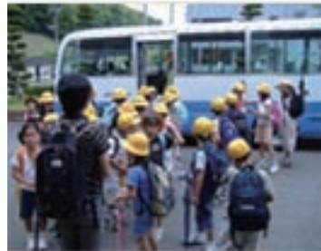
近隣小学校の工場見学 近隣の小学校3校から3年生計90名(各30名)が兵庫工場を見学。