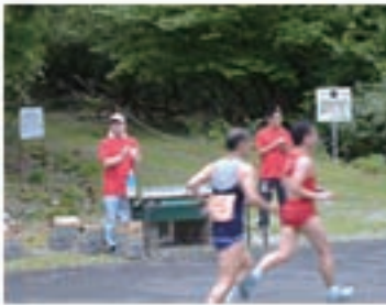
たたらぎ湖マラソン大会 (6/3)4名が給水係としてボランティア参加