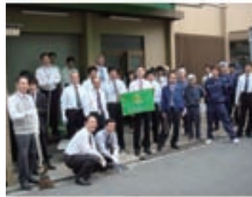
大阪支店 「支店近辺道路の清掃活動」