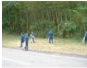
兵庫工場 「但馬 10万人のクリーン大作戦 (6/1)」に20名が参加いたしました。