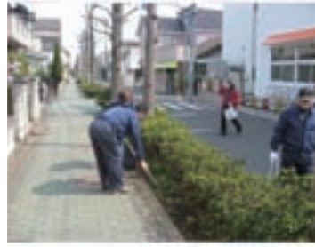
東京工場 「足立区門掃き支援活動」東京工場で毎月水曜日に周辺約100m四方を4ブロックに分け、ゴミの収集を行っております。