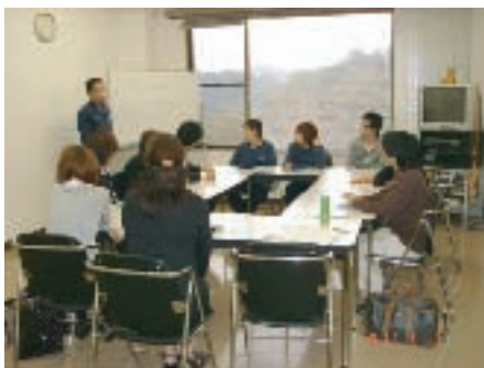
新入社員フォローアップ研修(10/12-10/13 兵庫工場)

4/2~4/5の4日間、本社で入社時の集合研修を行いました。「シーレックスの歴史」「コミュニケーション講座」「就業規則」「印刷概論」「取扱商品の説明」「改善提案制度」「通信教育制度」「安全衛生」「5S」「ISO」「プライベートマーク」など、シーレックスで働くうえで必要なことを学びました。