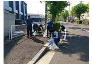
東北営業所・東北工場