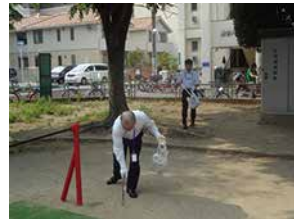
大阪支店・SLX大阪（株）