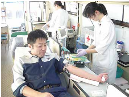
●兵庫工場で献血に参加する従業員