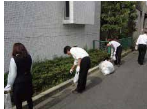
大阪支店・SLX大阪（株）