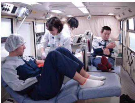
●兵庫工場で献血に参加する従業員