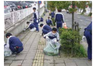
東北営業所・東北工場